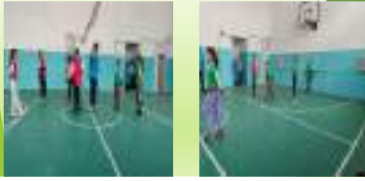
“Ұлттық тәрбие-зорлық зомбылықтың алдын алу!”