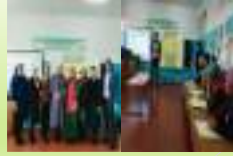
“Отбасы -бақыт бесізі”