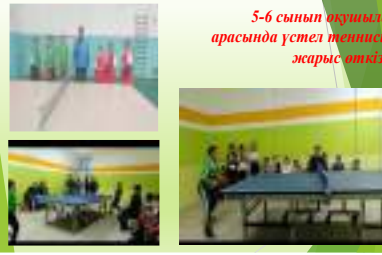
5-6 сынып оқушылары арасында үстел теннисінен жарыс өткізілді