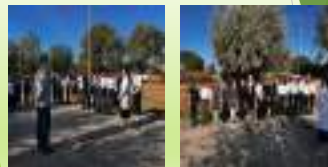
Төтенше жағдай оқу жаттығуы өткізілді.