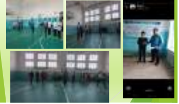
«Салдауатты өмір салтын насихаттау» нашіақорлыққа қарсы күрес мақсатында өткізілген кіші волейболдан жарыс